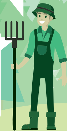
REJEC OVAC in LASTNIK GOZDA

Veseli me, da obnovljamo poškodovan gozd z vrstno pestrimi sadikami, ki so bolj odporne na podnebne spremembe.