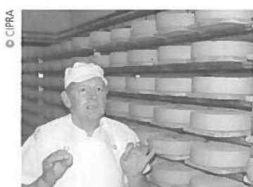
Pridelava specialitet - tržna niša, ki uživa vedno večjo priljubljenost

V ta namen je seveda treba razviti in uvesti ustrezne oblike poslovanja, npr. kmečke zadruge in združenja. Prihodnost alpskega hribovskega kmetijstva je v visokokakovostnih regionalnih pridelkih na podlagi jasno predpisanih okoljskih standardov. Znak kakovosti in označbe geografskega porekla oz. geografske označbe so namenjeni zaščiti teh kmetijskih proizvodov in varujejo njihove posebne lastnosti. V konkurenčnem boju z drugimi bodo najbolj uspevala območja z jasno identiteto in smislom za inovacijo.