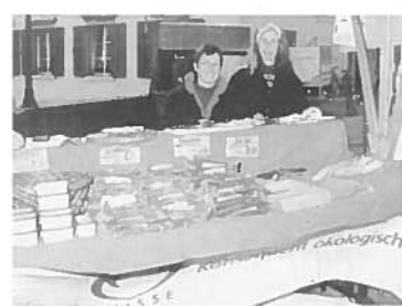
Trženje kakovostnih izdelkov na regionalni ravni kot priložnost za preživetje hribovskega kmetijstva

Kmetijstvo v Alpah bo lahko preživel samo, če se bo usmerilo v kakovostne pridelke, ki se bodo tržili na regionalni ravni. S kmetijsko pridelavo specialitet se odpirajo tržne niše za ekološko kakovostno meso, mleko, zelenjavo itd. V ospredju mora biti raba zemljišč, ki je sprejemljiva za okolje in prilagojena krajevnim pogojem, in kot tako jo je treba tudi spodbujati.