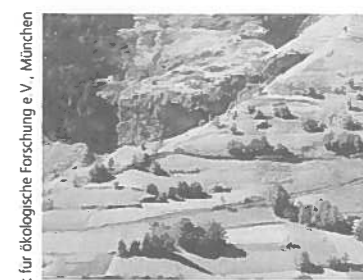
Hribovsko kmetijstvo ima pri ohranjanju kulturne krajine pomembno vlogo

Zvezni inštitut za vprašanja kmetov v gorskih območjih