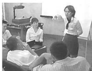
Predstavniki srednjeazijskih gorskih vasi so bili navdušeni nad zasnovo delovanja Povezanosti v Alpah

Leto gora je za nami, ideja o solidarnosti med alpskimi in drugimi gorskimi območji pa se je šele začela razvijati. To je tudi razlog, da se je CIPRA zavzela za ustanovitev združenja srednjeazijskih gorskih vasi.