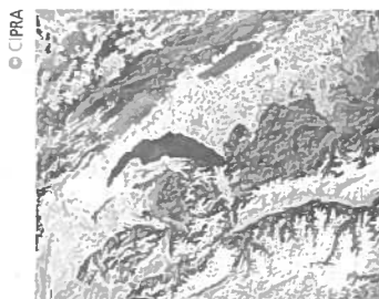
Območje Ženevskega jezera

Dosje je objavljen na spletnem naslovu: http://www.alpmedia.net/d/dossier_detail.asp?DossierID=10&Sprache=5 (sl)