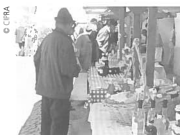
Prodaja pridelkov visoke kakovosti na tedenski tržnici

Skorajda dve tretjini kmetij si dohodka ne zagotavljata več samo iz kmetijske dejavnosti, temveč iščeta možnosti za njegovo povečanje v dopolnilnih dejavnostih kot kombinaciji kmetovanja z nekmetijskimi dejavnostmi (npr. turistična dejavnost na kmetiji).