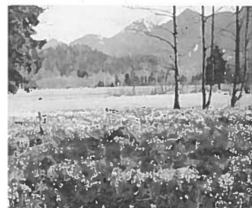
Po opustitvi kmetovanja nastopi sukcesija, odvisna od rastišča

Bogastvo Alp izvira iz velike raznovrstnosti habitatov ter rastlinskih in živalskih vrst. V tem pogledu je kmetijstvo izredno pomembno, saj kmetovanje s svojimi različnimi oblikami pomembno vpliva na ohranjanje biotske raznovrstnosti kmetijske krajine.