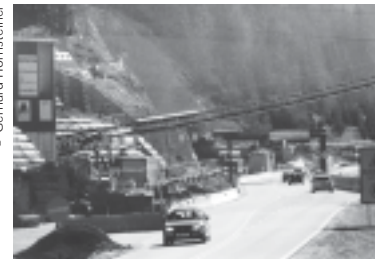
Predor pri Strengnu na arlberški hitri cesti S16 v Avstriji