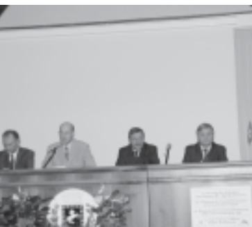
Obveščanje medijev pred 19. zasedanjem Stalnega odbora.

Ur. – Odkar je Italija pred letom dni prevzela predsedstvo Alpske konvencije, se je odlikovala predvsem s svojo nedejavnostjo. Končno je bil določen datum prvega zasedanja Stalnega odbora Alpske konvencije pod italijanskim predsedstvom – 6. in 7. september 2001. Ker pa je bilo gradivo za zasedanje odposlano šele nekaj dni pred začetkom zasedanja, se ministrstva posameznih držav sploh niso utegnili dogovoriti o pomembnih odločitvah.