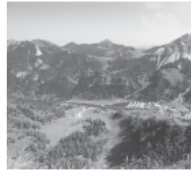
V Malbunu iščejo nove ideje in zasnove za področje turizma.