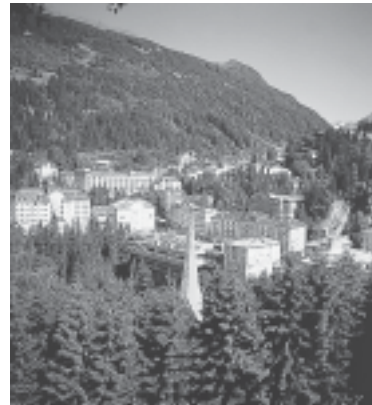
V dolini Gastein so razpravljali o trajnostnem razvoju doline.