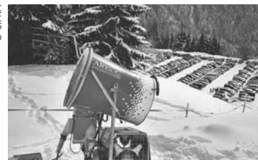
Trend, ki narašča: uporaba snežnih topov.