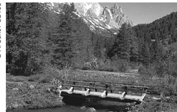
Dolina Clarée (Hautes-Alpes): tako lepa, tudi brez avtomobila!