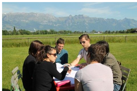
V okviru projekta YSAM mladi skupaj s politiki raziskujejo udeležbo mladih v procesih odločanja in upravljanja na lokalni ravni.

Viri in več informacij na: http://www.cipra.org/sl/sporocila-za-medije/za-kontinuiteto-in-spremembe