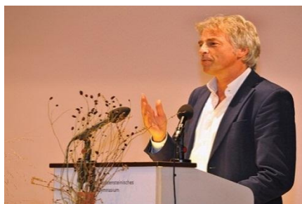
Ulrich Eichelmann je za svoja prizadevanja pri ohranjanju evropskih tekočih voda prejel letošnjo Veliko Bindingovo nagrado.

Viri in več informacij na: http://mountainwilderness.ch/aktuell/einzelansicht/artikel/unsere-berge-brauchen-keine-geschmacksverstaerker/ (de, fr), http://mountainwilderness.ch/aktuell/einzelansicht/artikel/ausbau-des-schabellgrates-nicht-gesetzteskonform/ (de, fr)