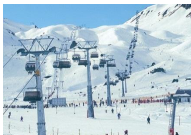
V Alpah gradijo nova in nova smučišča – brez obzira do narave in pokrajine.

Viri in več informacij na: www.binding.li/html/binding-preis1.html (de)