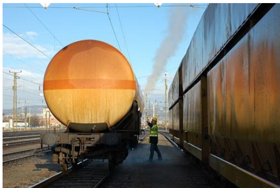
Študija Evropskega parlamenta je pri projektu gradnje železniške proge na relaciji Lyon–Torino ugotovila številne pomanjkljivosti.