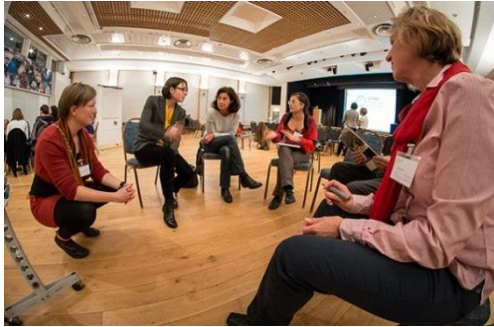
Udeleženci letne konference CIPRE so razpravljali o kakovostnem življenju v Alpah.