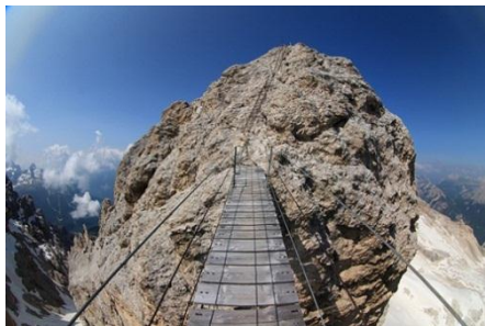
V okoljskih organizacijah so kritični do spektakularnih visečih mostov in razglednih ploščadi, saj ti le uničujejo lepoto gora.