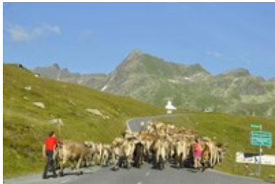
Podnebne spremembe vplivajo na ljudi, živali in naravo.