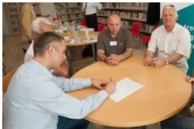
Alpske občine v Italiji podpirajo Listino iz Budoie.

S podpisom Listine iz Budoie (Carta di Budoia) so se italijanske alpske občine zavezale k uresničevanju ukrepov za prilagajanje podnebnim spremembam.