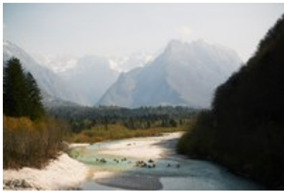
Kajakaši na poti od Alp proti morju

Konec marca se je v Sloveniji začela največja akcija na področju varstva voda v Evropi Balkan Rivers Tour, katere cilj je ohraniti še zadnje naravne vodotoke.