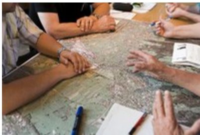
CIPRA je za temo letne konference 2017 izbrala prostorsko načrtovanje v Alpah.

Območja z izjemnim potencialom, ki so podvržena velikim pritiskom z vidika rabe, so zoperstavljeni obrobni pokrajini, ki beležijo visoko stopnjo odseljevanja.