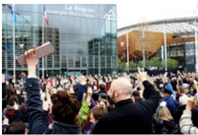
Demonstranti v Lyonu/F so molče in z dvignjenim kazalcem opozarjali na pravico izraziti svoje stališče.

Obstoj društev v regiji Auvergne – Rona - Alpe je ogrožen, zato so v gibanju Vent d'Assos organizirali protestno akcijo, s katero so želeli opozoriti nase ter izvoljene predstavnike in državljane spodbuditi k ukrepanju.