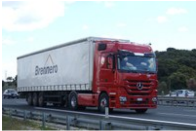
Cestni tovorni promet se na Brennerju še naprej povečuje.

Gotthard je dosegel rekordni najnižji delež čezalpskega tovornega prometa, odkar so v Švici sprejeli zakon o preusmeritvi tovora na železnico. Število tovornih vozil, ki potujejo prek prelaza Brenner, pa se še naprej povečuje.