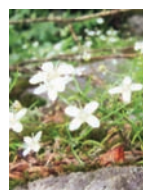
Moos-Nabelmiere schattiger Blockschutt Blütezeit: V – IX bis 2300 m