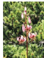
Türkenbund Waldränder Blütezeit: VI – VIII meist Kalk bis 2800 m