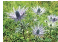
Alpen-Mannstreu Hochstaudenfluren Blütezeit: VII – IX Kalk, SO-Alpen bis 2500 m