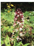
Brand-Knabenkraut Trockenwiesen Blütezeit: V – VI auf Kalk bis 2100 m