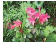
Bewimperte Alpenrose Schutthalden, Legföhrenzone, Kalk Blütezeit: V – VII 1200 - 2600 m