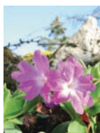
Clusius-Primel Kalkfelsen, Rasen Blütezeit: V – VIII Kalk, O-Alpen bis 2200 m