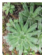
Hosts Steinbrech felsiges Gelände Blütezeit: V – VII meist Kalk 1300 - 2500 m