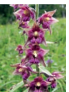
Rotbraune Stendelwurz Trockenrasen, Wälder Blütezeit: V – VIII bis 2200 m