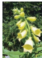
Großblütiger Fingerhut Wälder, steinige Orte Blütezeit: VI – VIII bis 1600 m Giftpflanze