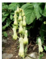
Gelber Eisenhut Hochstaudenfluren Blütezeit: VI – VIII bis 2400 m Gift- und Heilpflanze