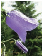
Rundblättrige Glockenblume Wiesen, lichte Wälder Blütezeit: V – IX bis 2200 m