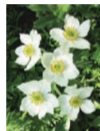
Berghähnlein Bergwiesen Blütezeit: VI – VII Kalk 1400 - 2500 m