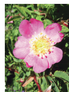
Gebirgs-Rose Bergwälder, Blockhalden Blütezeit: V – VIII bis 2700 m