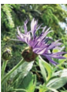
Bergflockenblume Hochstaudenfluren Blütezeit: V – VII meist auf Kalk bis 2100 m