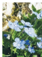
Gedenkemein feuchte Bergwälder Blütezeit: III – V kalkmeidend bis 1200 m