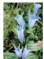
Schwalbenwurz-Enzian Trockenrasen, Wälder Blütezeit: VIII – X gerne auf Kalk bis 2200 m