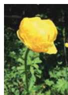
Trollblume Feuchtwiesen Blütezeit: V – VIII bis 2800 m