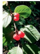
Rote Heckenkirsche Wälder Blütezeit: V – VII meist auf Kalk bis 1800 m