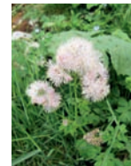
Akelei-blättrige Wiesenraute feuchte Wiesen, Auwälder Blütezeit: V – VII bis 2500 m