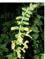
Klebriger Salbei Waldlichtungen, Gebüsche Blütezeit: VI – IX meist Kalk bis 1800 m