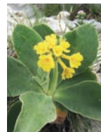
Alpen-Aurikel Kalkfelsen, alpine Rasen Blütezeit: V – VII bis 2900 m