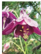
Dunkle Akelei Bergwälder, -wiesen Hochstaudenfluren Blütezeit: VI – VIII auf Kalk bis 2000 m