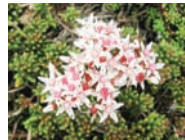
Weißer Mauerpfeffer Felsen, Mauern, Trockenrasen Blütezeit: VI – VIII bis 2500 m