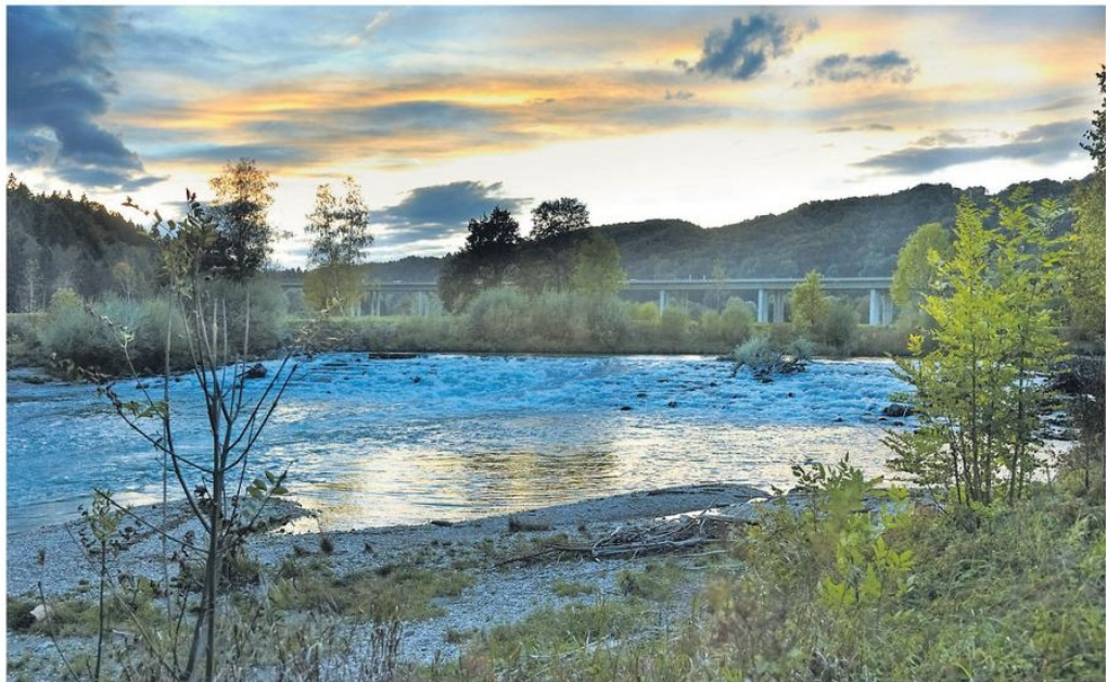
Äschen, Bachforellen und Renken leben in diesem Abschnitt der Loisach am Rande des Kocheler Moors, wo das Schachtkraftwerk stehen soll. Durch dessen Turbine könnten kleinere Fische angeblich sogar gespült werden, ohne Schaden zu nehmen.

In Großweil setzen sie denn auch hohe Erwartungen in das Schachtkraftwerk.