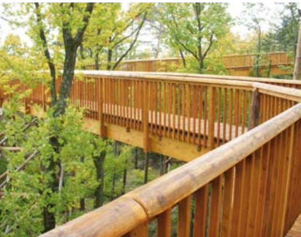
Barrierefreier Baumgipfelweg Althodis im Naturpark Geschriebenstein an der Grenze zu Ungarn.

Am Geschriebenstein erreichen die Ausläufer der Alpen die Grenze zu Ungarn. Am Gipfel des Berges steht eine steinerne Aussichtswarte. Vor einigen Jahren verlief unmittelbar hier noch der Eiserner Vorhang, heute ist sie ein Schnittpunkt von österreichischen und ungarischen Wanderwegen im grenzüberschreitenden Naturpark Geschriebenstein – Irrotkö. Im Inneren der Warte befindet sich eine Ausstellung über die Ereignisse rund um die Abstimmung, die das Burgenland zu Österreich brachte. Von der Aussichtsplattform kann man das an Stelle des Eisernen Vorhanges getretene Grüne Band besser sehen als kaum anderswo: Am ehemaligen Todesstreifen entlang der Grenze stockt heute ein dichter Birkengürtel, der sich vom umgebenden Nadelmischwald hell-