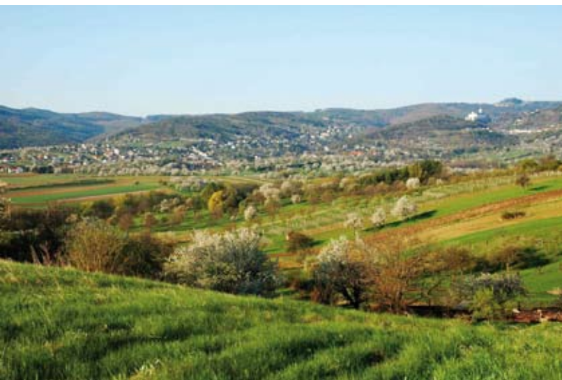
Blick auf das Rosaliengebirge mit Burg Forchtenstein.

Naturräumlich ist das Gebiet von großen geschlossenen Waldflächen geprägt. Bedingt durch das reiche Vorkommen von Serpentin ist das Bernsteiner Bergland großflächig mit natürlichen Rotföhrenwäldern bestockt, die sich an steinig und flachgründigen Standorten zu Felsfluren und Trockenrasen auflichten. Bei Bernstein befindet sich das größte Serpentinvorkommen in Österreich. Das grünliche, leicht sägbare