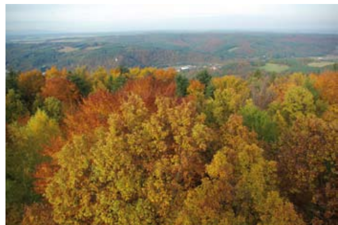
Ausgedehnte Laubwälder bei Lockenhaus.

biet weit verbreiteter Eichen-Hainbuchenwälder, die v.a. im Günser Bergland in Buchen-Tannen-Fichtenwäldern übergehen. In höheren Lagen wurden sie vielfach durch Fichtenforste ersetzt. Die Buchen-Tannenwälder zeichnen sich durch einen geringen Anteil an Tannen und weitgehend einheitlichen Bestandsaufbau aus. Aufgrund der hohen Vitalität ist jedoch eine ausreichende Naturverjüngung der Rotbuche vorhanden, sodass unter Beibehaltung der derzeitigen Waldbewirtschaftung die noch vorhandenen Bestände in ihrer Substanz nicht bedroht sind. Gleiches gilt für die Eichen-Hainbuchenwald-Standorte. In bewaldeten Talräumen kommen Schluchtwälder und schmale bachbegleitende Auwälder zur Ausbildung. Auch wenn es sich im Burgenland somit nicht um typischen Bergwald handelt, können dennoch die Bestimmungen für Nutzwälder des Bergwaldprotokolls als umgesetzt betrachtet werden. Im Übergangsbereich zwischen Wald und ackerbaulich genutzten Flächen sind Streuobstwiesen und Reste einst beweideter Trockenrasen erhalten geblieben. Am Südabfall des Günser Berglandes befindet sich am