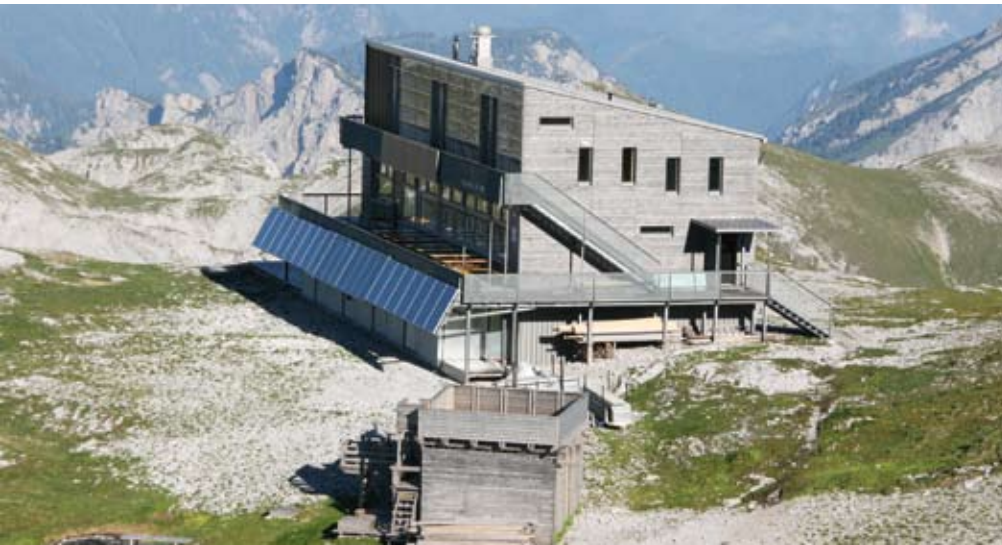
Das neue Schiestlhaus am Hochschwab.

Schweiz an einer Exkursion auf das Schiestlhaus teil. In der Diskussion konnten wichtige Rahmenbedingungen und Spannungsfelder für das alpine Hüttenwesens identifiziert werden.