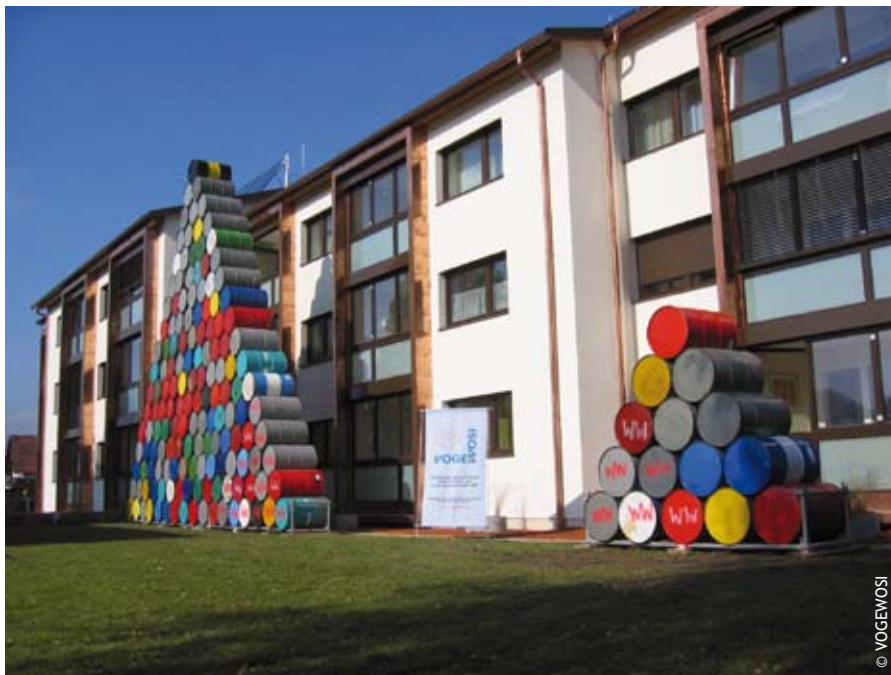
Visualisierung des Ölverbrauchs vor und nach der Sanierung am Rankweiler Schleipfweg.

Die Vorarbeiten zu dem Projekt begannen bereits 2006: Anhand von thermografischen Aufnahmen und Dichtheitsprüfungen wurden Schwachstellen des Gebäudes ermittelt. Folgende Maßnahmen an der Wohnanlage wurden umgesetzt: Anbringung einer Vollwärmeschutzfassade mit 25 cm Wärmedämmung an der Außenfassade, Dämmung der Kellerdecke mit zusätzlich 16 cm und des obersten Geschosses mit 34 cm. Im gesamten Gebäude wurden die Wohnungsfenster, Stiegenhausfenster und