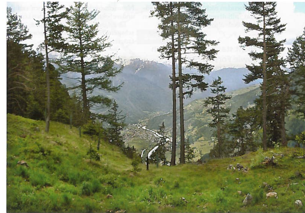
Abb. 1: Blick vom Naturparkhaus Kaunertal ins Lechtal. Das Gebiet ist Teil der trilateralen Pilotregion des ökologischen Verbunds Rätisches Dreieck.

Durch die Konvention selbst wird die Umsetzung des Naturschutzprotokolls (zurzeit) mit Hilfe von zwei Plattformen unterstützt: Plattform ökologischer Verbund (eingesetzt 2006) und Plattform große Beutegreifer, wild lebende Huftiere und Gesellschaft (eingesetzt 2009). Sie bieten Foren für Vertreterinnen und Vertreter der Vertragsstaaten, Forschungseinrichtungen und zivilgesellschaftliche Organisationen, um länderspezifische Ansätze zu diskutieren