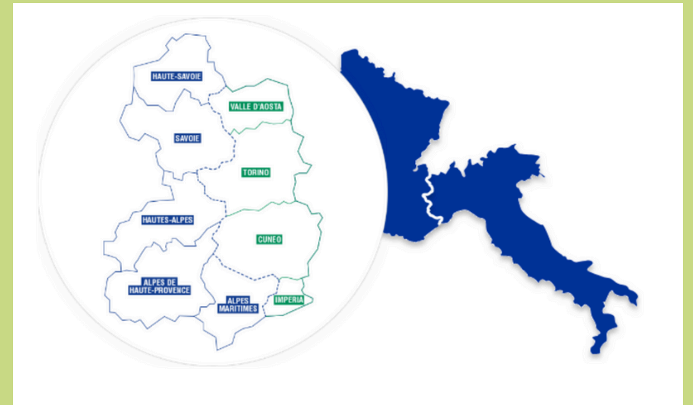
Les territoires de l'espace ALCOTRA