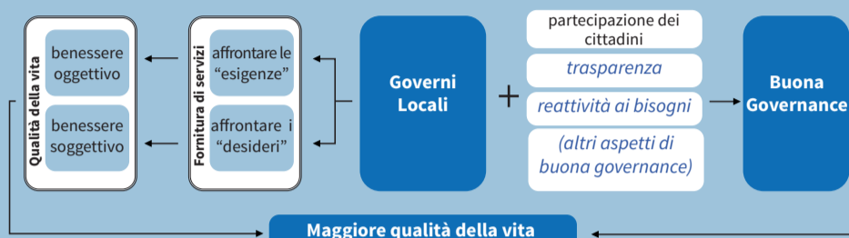
Figure 3: Il ruolo del livello locale nell'assicurare una buona qualità della vita.

Rispondendo non solo ai bisogni ma anche ai desideri , e migliorando le capacità , rafforzando al contempo la governance partecipativa , le autorità locali possono influenzare in modo significativo il benessere dei cittadini ; per realizzare ciò, è necessario costruire buoni sistemi di governance a livello locale.