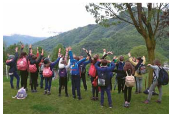
An der frischen Luft: GrundschülerInnen setzen sich bei Ausflügen mit Naturvielfalt auseinander.