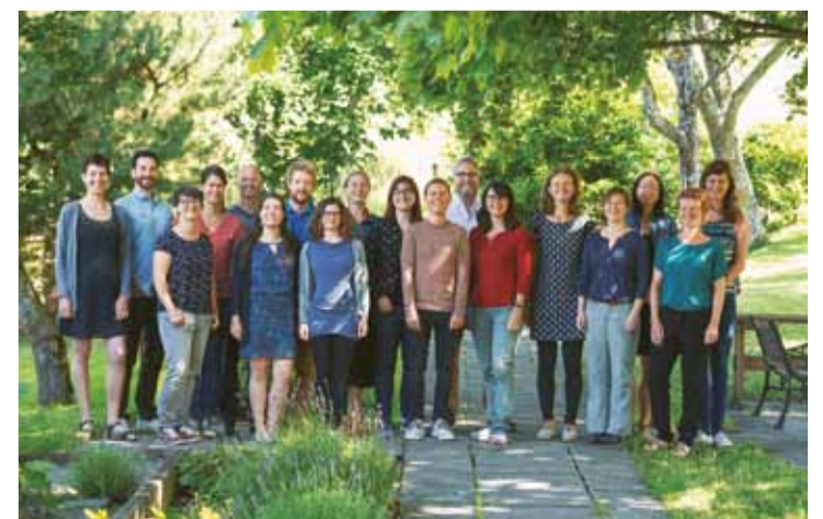
Die CIPRA: Nationale Vertretungen und Vorstände, Jugendbeirat und CIPRA International (von oben nach unten).