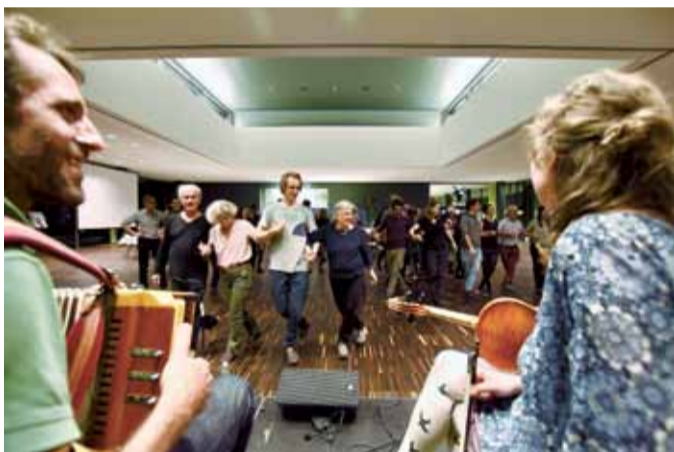
Kultur bewegt: Bei der CIPRA-Jahresfachtagung in Altdorf/CH schwingen alle das Tanzbein.