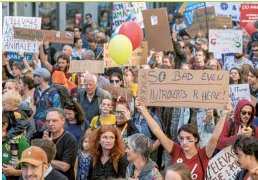
Für das Klima: Junge streiken in Bern/CH.

2019 gehen weltweit Tausende junge Menschen auf die Strasse, um für eine lebenswerte Zukunft zu demonstrieren. Was 2018 mit dem Schulstreik der damals 15-jährigen Greta Thunberg vor dem schwedischen Parlament begann, geht um die Welt. Auch in den Alpen demonstrieren Schülerinnen und Schüler für mehr Klimaschutz, in Chur/CH, Turin/I, Nova Gorica/SI, Vaduz/LI, München/D, Grenoble/F, Bregenz/A und vielen mehr.