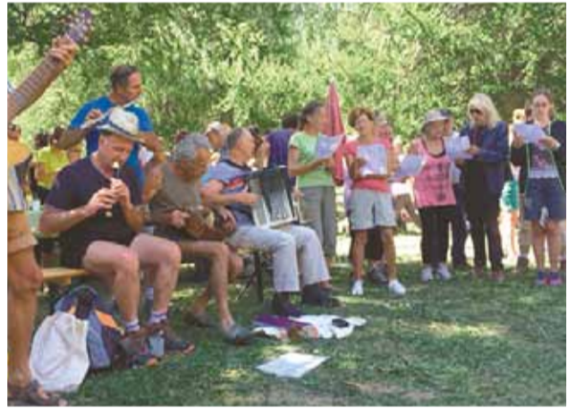
Mit Musik und Gesang: Jung und Alt weihen die renovierte Berghütte der Gemeinde Villars-Colmars ein.