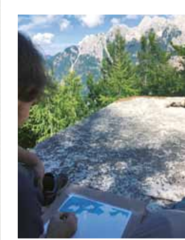
Gipfel auf Papier: Junge Leute setzen sich künstlerisch mit dem Vršičpass auseinander.

➤ Grauer Beton versiegelt den Boden, blaue Anzeigetafeln säumen eine Landstrasse, rote Fahnen flattern im Wind. Sie alle werben für Autohäuser, Tankstellen oder Supermärkte. Mit eindrucksvollen Bildern aus unserem Alltag lenkt der österreichische Raumplaner Reinhard Seiss den Blick der Anwesenden auf die Absurditäten, mit denen wir den öffentlichen Raum gestalten. Bei der Vernissage des Themenhefts SzeneAlpen «Landschaft ist verhandelbar» im März in Vaduz steht der Umgang mit Landschaft im Fokus. Sie ist ein vielsagender Spiegel einer Wegwerfgesellschaft. Für die Liechtensteiner Umweltministerin Dominique Hasler bedeutet Landschaft nicht nur Heimat, sondern auch Verantwortung. In ihren Grussworten würdigt sie die enge Zusammenarbeit mit CIPRA International in Liechtenstein. Die Landschaftsarchitektin Catarina Proidl vertieft das Thema am Beispiel der Gestaltung des Dorfparks in Triesen. Die junge Liechtensteinerin Sandra Fausch erzählt von ihrer persönlichen Beziehung zu der Landschaft, in der sie aufgewachsen ist.