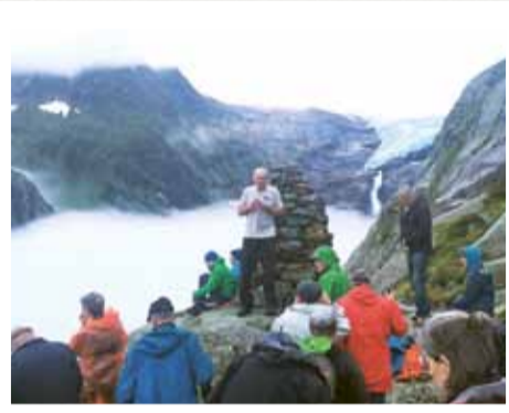
Protest für eine Urlandschaft: AktivistInnen beim Trift-Camp 2019 in der Schweiz.