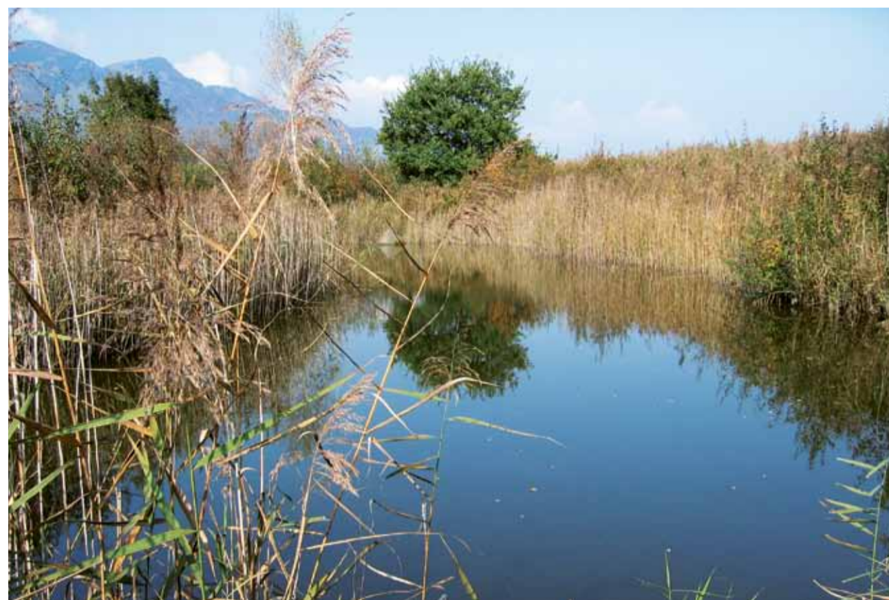
Flachmoore schützen: Das Ruggeller Ried/LI speichert Wasser und Treibhausgase.