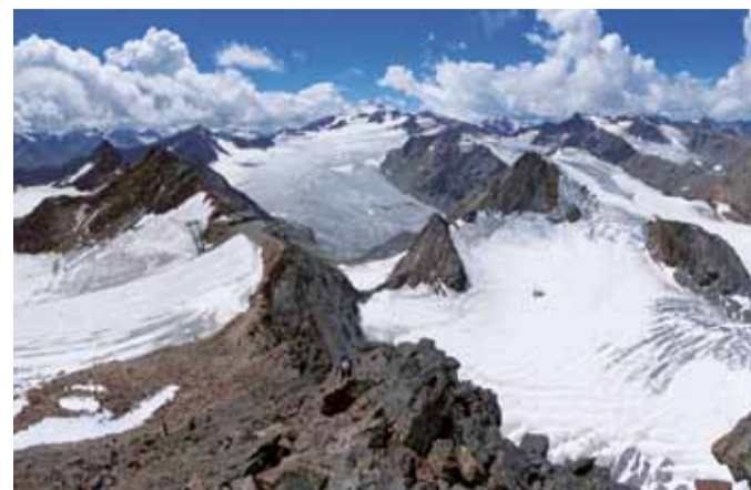
Bedrohte Berglandschaft: Die Pitztaler und Ötztaler Skigebiete planen eine Grossbaustelle.