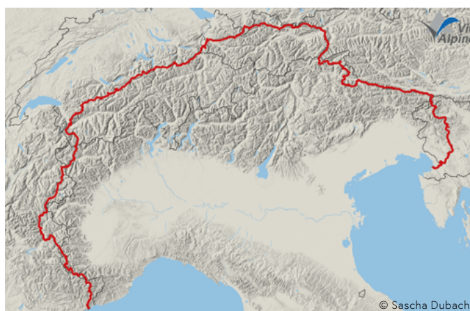
Übersicht der Via Alpina Route