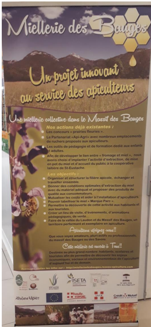
Kakémono de présentation du projet