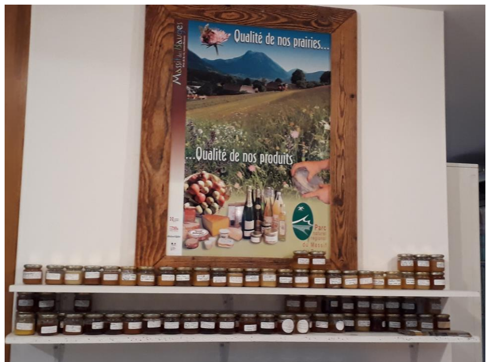
Bibliothèque d'échantillons de miels, avec les dates et lieux de récolte