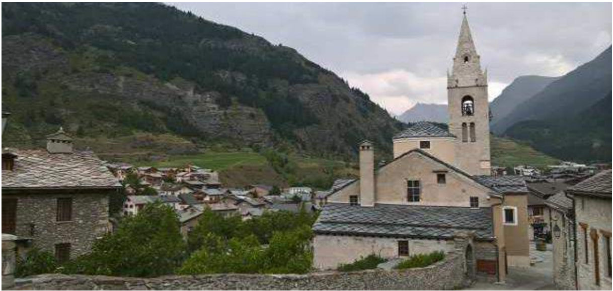
La commune de Stropo (IT)