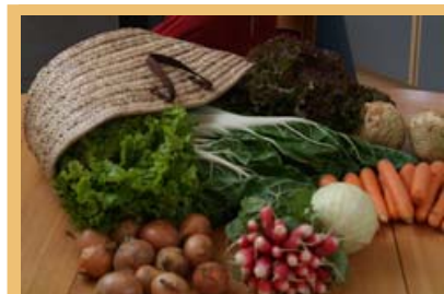
A travers ses efforts en faveur du commerce équitable, Sonthofen soutient aussi les produits régionaux.

http://www.alpenstaedte.org/fr/actuel/nouveautes/3824 (de/it/fr/sl).