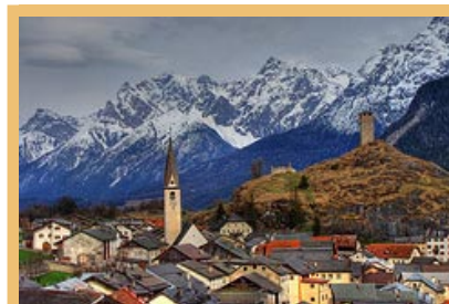
La commune d'Ardez représentait le réseau de communes au sommet mondial de Copenhague sur le climat.