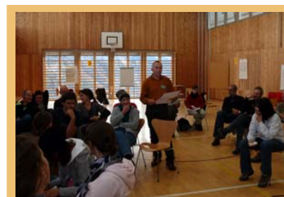
Les 14 et 15 novembre, plus de 50 habitants de Tschlin se sont retrouvés pour la deuxième conférence sur l'avenir.

Il y a environ dix ans se tenait dans la commune de Tschlin/CH la première conférence sur l'avenir, qui a donné vie à toute une série de projets encore existants. La vitrine de cette manifestation est la petite brasserie « bieraria engiadina », dont la réussite a convaincu la commune de tenir une nouvelle conférence sur l'avenir. Cette dernière a donc été organisée par « Alliance dans les Alpes » Suisse et co-financée par dynAlp-climate. Il s'agissait d'évaluer le statu quo de la commune ainsi que d'analyser les forces et faiblesses, d'élaborer des visions et de prévoir des actions concrètes. La conférence a eu pour résultat pratique la formation de quatre groupes de projets. Les thèmes transversaux essentiels que sont la lutte contre le changement climatique et les énergies alternatives sont intégrés dans tous les projets. En 2010, dynAlp-climate soutiendra également ces échanges régionaux. Pour en savoir plus : http://www.alliancealpes.org/fr/projets/dynalp-climate (de, fr, it, sl).