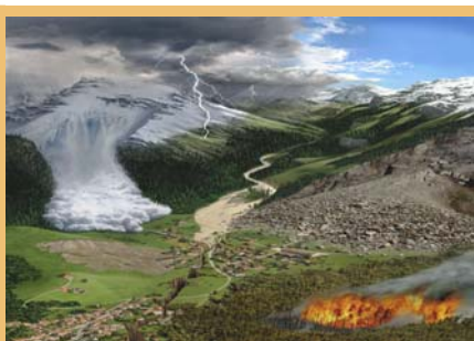
La conférence climatique de Mäder mettra en lumière le thème des actions d'atténuation.