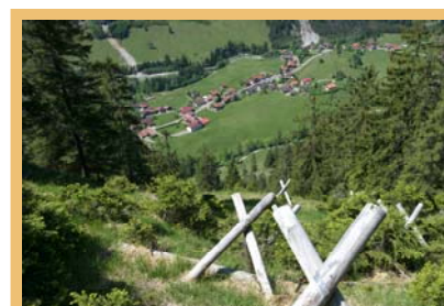
L'augmentation des risques naturels exige des stratégies d'adaptation pertinentes.

Dans la région modèle de l'Oberallgäu, les communes vecteurs du projet sont Burgberg et Sonthofen. Un SIG montre en un coup d'oeil les risques naturels et les utilisations de l'espace pertinents. Grâce à ces informations jusqu'ici uniquement accessibles par le biais de plusieurs sources, les communes peuvent éviter des mesures de protection coûteuses. Si, en outre, on ambitionne un développement local cohérent, ce système assure des filières courtes, une infrastructure finançable à long terme et des coûts de mobilité modérés. Pour en savoir plus : www.adaptalp.org (en)