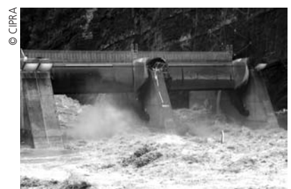
On investit moins dans les infrastructures en vue de la privatisation.