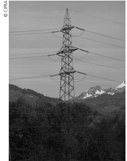
Les trois principaux fournisseurs d'électricité que sont EDF, RWE et EON contrôlent la majorité du marché.