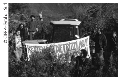
Action contre l'aménagement d'un terrain pour la pratique des sports motorisés et le test des chars d'assaut dans la région de la Frizzi Au/I.