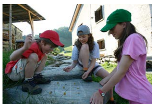
Les collaboratrices de la CIPRA montrent l'exemple : les enfants sont un plus pour la carrière.