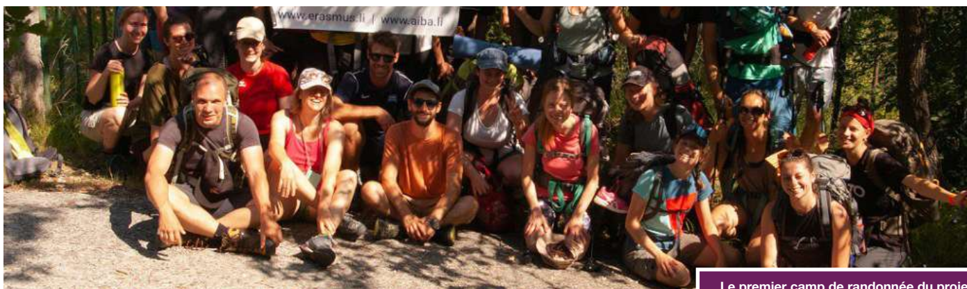
Le premier camp de randonnée du projet « Via Alpina Youth »