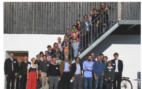
Une trentaine de participants étaient réunis pour cette étape du projet Alpstar

Plus d'infos : contactez Olivier ou www.alpstar-project.eu