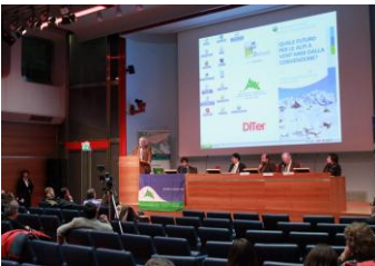
Les 20 ans de la Convention Alpine, Turin, nov. 2011