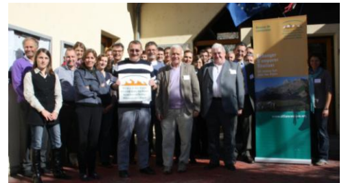
Les membres français réunis à Bourg d'Oisans le 20/10/2011