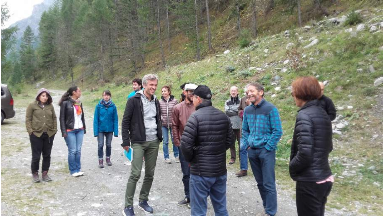
Évaluation et propositions de thèmes pour un voyage en 2018

Un dernier exercice est réalisé en extérieur afin de connaître les thèmes à aborder dans le cadre d'un futur voyage autour du tourisme durable.