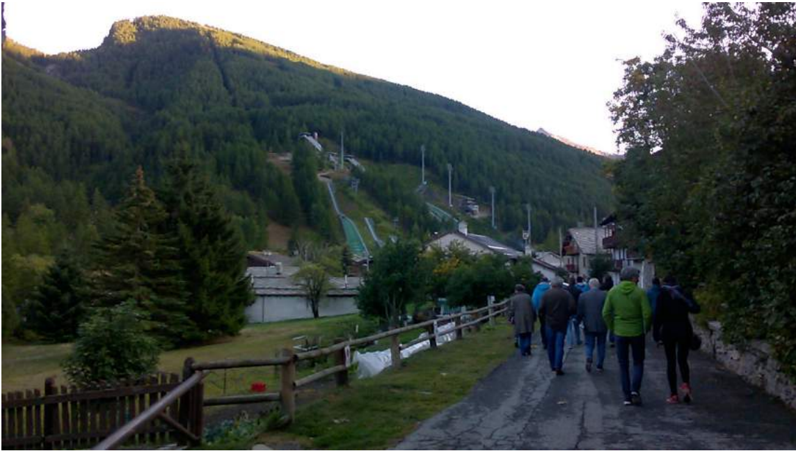
Visite de la commune de Pragelato / Italie

Tout au long du voyage d'étude, Pragelato s'est affirmée comme une commune s'orientant vers une autre forme de tourisme. Pragelato peut s'appuyer sur un tourisme de ski alpin grâce à la présence de Sestrières proche de la commune et développe d'autres activités complémentaires.