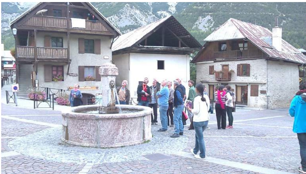
Visite de la commune de Vallouise

La journée se termine par une visite du village de Vallouise et de son patrimoine avec des arrêts au camping Huttopia et à la Maison du Parc des Écrins avec un court film sur la marque Parc.