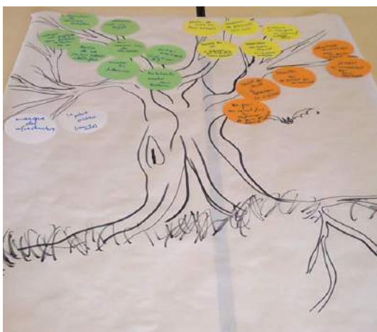
Ateliers de travail