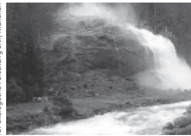
Die Alpenkonvention braucht ein Protokoll «Wasserhaushalt»