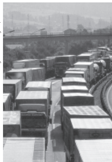
Neue Verkehrsinfrastrukturen führen zu mehr Verkehr