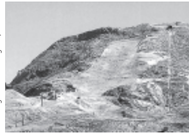
Pistenplanierungen beeinträchtigen das Landschaftsbild und die Flora