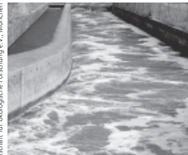
Zunehmende Verschmutzung beeinträchtigt die Gewässer

Eine einzige Toilettenspülung in den Industrieländern verbraucht so viel Wasser, wie eine Person in einem Entwicklungsland – wenn überhaupt – pro Tag für Trinken, Kochen und Waschen zur Verfügung hat.