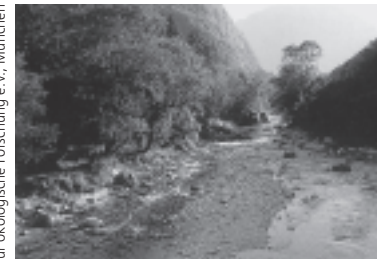
Die Alpen haben für ganz Europa eine Versorgungsfunktion

Überschwemmungen, Erdbeben und Lawinen führten uns in jüngster Vergangenheit erneut vor Augen, dass die Natur in den Alpen die Grenzen der Belastbarkeit erreicht hat. Um die Alpen zu schützen und eine umweltgerechte Entwicklung zu gewährleisten, braucht es heute grenzüberschreitende Zusammenarbeit, wie sie in der Alpenkonvention vorgesehen ist.