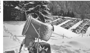
Tendenz steigend: Der Einsatz von Schneekanonen