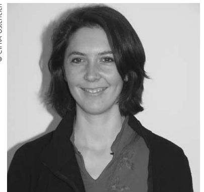
© CIPRA Österreich ... Geschäftsführerin Birgit Karre ...