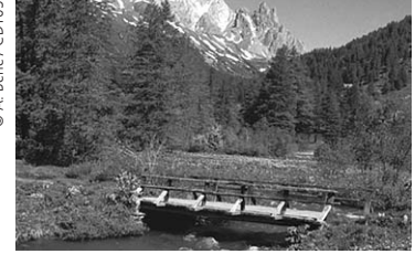
Das Clarée-Tal in den Hautes-Alpes: Doch so schön, auch ohne Auto.