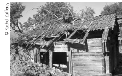
© Rachel Zufferey Abwanderung und Verödung in einigen Bergregionen.