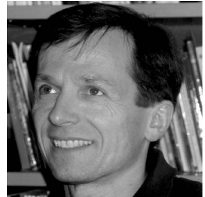
© CIPRA Österreich Präsident Norbert Weixlbaumer...

Alle Informationen zur Arbeit von CIPRA-Österreich sind auf http://www.cipra.at zu finden.