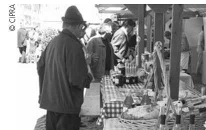
Absatzmärkte für lokale Produkte: Verbindung zwischen Zentren und Umland.