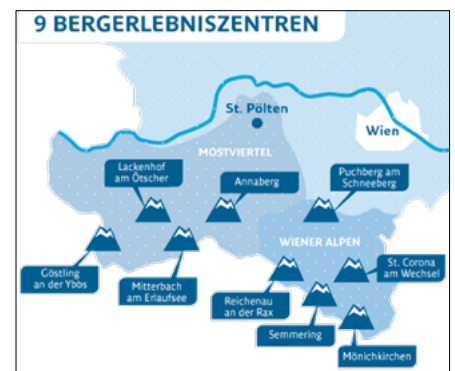
Abbildung: 9 Bergerlebniszentren Niederösterreichs.

bruck und Frankenfels-Laubenbachmühle, sowie das neue Naturparkzentrum Ötscher-Basis in Wienerbruck geben einen tiefen Einblick in die Besonderheiten der Alpen. Ausgehend von der Region rund um das 1.893 Meter hohe „Väterchen“ (Ötschan, Urslawisch) werden Fragen aus der Vergangenheit, dem Heute und der Zukunft gestellt. Im Mittelpunkt dabei bleibt die Landschaft der Alpen.