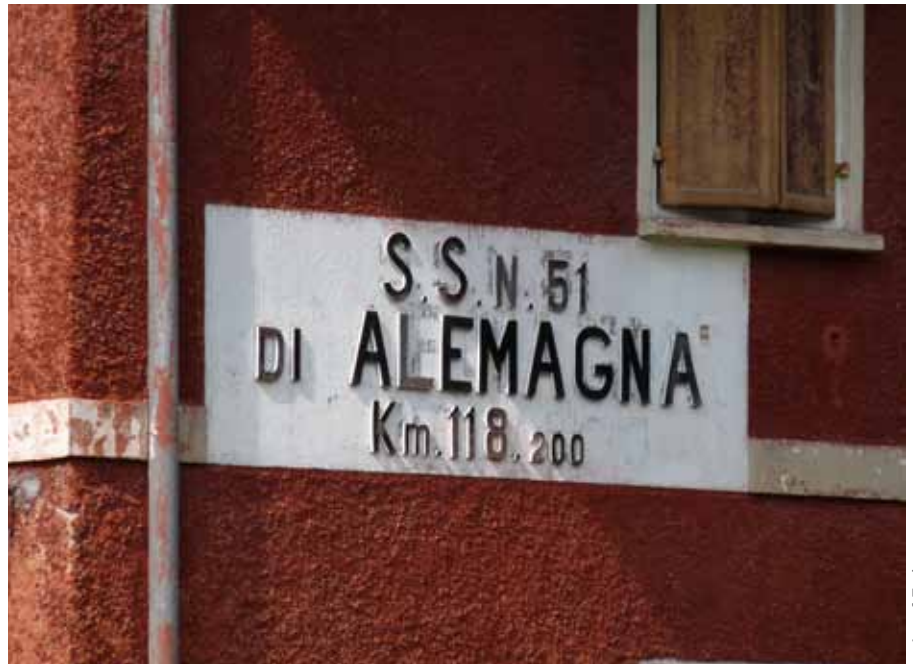
Die ALEMAGNA – seit Jahrzehnten symbolisiert dieser Name den Widerstand gegen den Bau neuer hochrangiger Straßen im Alpenraum (das Bild zeigt die Aufschrift „Alemagna“ auf einem der alten Straßen-Wärterhäuser zwischen Toblach und Cortina d’Ampezzo).

Zentral ist in der Stellungnahme der RSS folgende Aussage enthalten: Im Ergebnis besagt die italienische Erklärung, dass Art. 11 Abs. 1 VerkP der Möglichkeit nicht entgegenstehe, auf italienischem Staatsgebiet hochrangige Straßenbauprojekte für den alpenquerenden Verkehr zu verwirklichen. Dies widerspricht dem in Art. 11 Abs. 1 VerkP enthaltenen absoluten Verzicht. Die Erklärung kann somit nur dahingehend interpretiert werden, dass Italien bezweckt, die Rechtswirkung des Art. 11 Abs. 1 VerkP in der Anwendung auf sich selbst auszuschließen, womit ein Vorbehalt im Sinne von Art. 2 Abs. 1 lit. d WVK vorliegt.