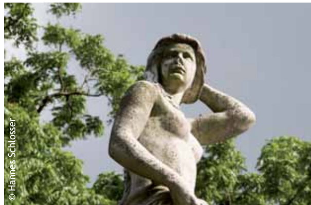
Das Donauweibchen im Wiener Stadtpark, eine Sagenfigur, die notleidenden Fischern half, oder vor Hochwasser schützte.

Juni 2011 beschlossen. Die drei wesentlichen Bedingungen – keine neuen gesetzlichen Regelungen, keine neue Organisationsstrukturen, kein neues Geld – wurden