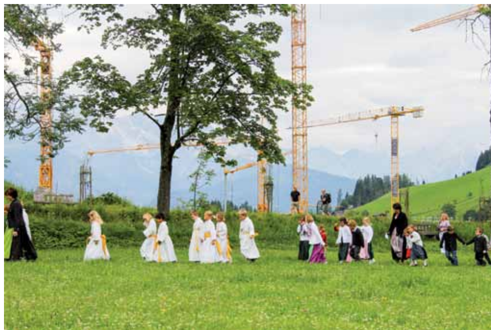
Kontinuität und Wandel. Fronleichnamprozession in Werfenweng, Pongau.

den Ballungsräumen. Die Aufrechterhaltung einer Basisinfrastruktur im Bereich der Versorgung mit Gütern des täglichen und mittelfristigen Bedarfs (Lebensmittel und Drogerieartikel etc.) kann nur dann erreicht werden, wenn genügend BewohnerInnen in den Gemeinden verbleiben. Dafür müssen die notwendigen Voraussetzungen, z.B. durch angepasste Mobilitätsangebote in Streusiedlungsgebieten, durch die Verbesserung der Kinderbetreuung für Beschäftigte im Tourismus oder durch mobile Serviceangebote, geschaffen werden.