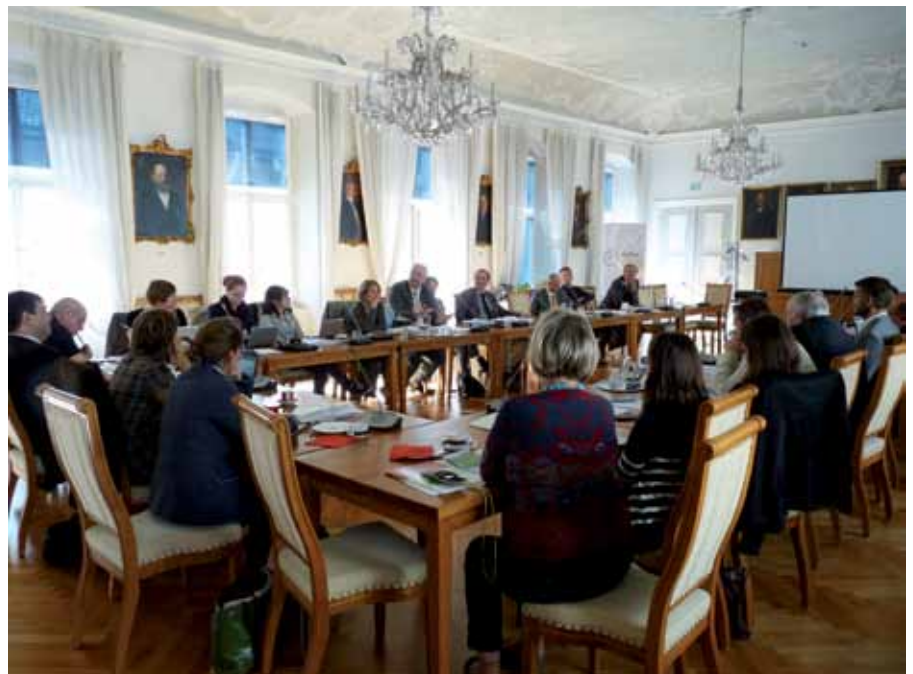
Das Innsbrucker Landhaus (Rokokosaal) war Schauplatz des I. Workshops im Rahmen des Projekts Alpen.Leben.