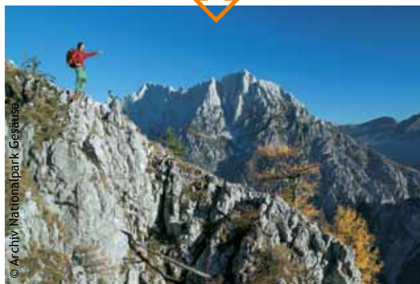
Vom größten Waldnationalpark Österreichs, dem Nationalpark Kalkalpen, über das Naturschutzgebiet Totes Gebirge, bis zum Nationalpark „Gesäuse“, könnte der Art. 12 „Ökologischer Verbund“ des Protokolls „Naturschutz und Landschaftspflege“ der Alpenkonvention modellhaft umgesetzt werden.