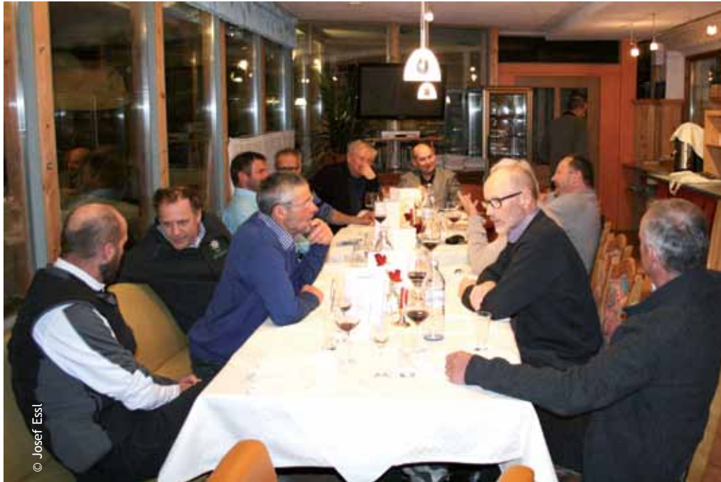
Alte Weggefährten und Freunde, die sich seit 20 Jahren gegen das Autobahn-Monster „Alemagna“ stemmen bei ihrem Treffen in Kartitsch Ende März 2014.