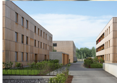
Complesso residenziale Lerchpark