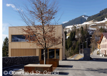
Centro comunale di St. Gerold