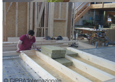
Azienda produttrice di legnami Wolfurt