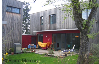
Complesso residenziale Wolfurt