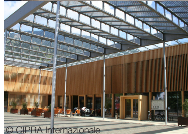
Centro comunale di Ludesch