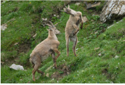
Compagni di giochi in pericolo: giovani esemplari di stambecco delle Alpi muoiono per cause ignote nel parco nazionale del Gran Paradiso.

La popolazione di stambecchi del Parco Nazionale del Gran Paradiso -il primo Parco Nazionale italiano, istituito nel 1922, che circa un secolo fa permise di salvare lo stambecco da probabile estinzione- è seriamente minacciata. I tre quarti dei cuccioli di stambecco, infatti, muoiono prima del compimento del primo anno di vita ed altri non sopravvivono all'inverno. Così dei 5000 stambecchi censiti nel 1993 oggi ne rimane circa la metà. Misteriosa la causa della moria che colpisce i giovani ungulati. Tra le ipotesi vagliate dai veterinari del Parco e dai ricercatori, quella di un agente patogeno che però dovrebbe colpire anche i camosci che invece non manifestano problemi. Altra ipotesi è la scarsità di neve degli ultimi decenni che favorirebbe la sopravvivenza di femmine anziane le quali partorirebbero cuccioli più deboli. La terza ipotesi fa riferimento al cambiamento climatico: le primavere precoci porterebbero a maturazione l'erba più velocemente ed i capretti, terminato l'allattamento, si troverebbero di fronte ad erba secca con