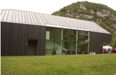
Il Museo Sloveno delle Alpi spalanca le porte per avvicinare i giovani al modo dell'alpinismo.

Oltre mille fra alpinisti e amanti della montagna si sono dati appuntamento a Mojstrana (Slovenia) all'inizio di agosto per l'inaugurazione del Museo Sloveno delle Alpi (Slovenski planinski muzei - SPM). La forte affluenza di visitatori dimostra quanto sia indispensabile la presenza di un'istituzione del genere nelle Alpi slovene. Il museo delle Alpi oggi è una realtà soprattutto grazie agli sforzi di Miro Eržen, che per 25 anni si è battuto per questo progetto. Il nuovo museo è stato inaugurato dal Presidente sloveno Danilo Türk. Secondo le previsioni, il museo dovrebbe attirare circa 30.000 visitatori all'anno e conquistarsi così un posto di tutto rispetto tra le attrazioni turistiche di Mojstrana. L'edificio, che si sviluppa su circa 1.200 m2 di superficie, ospita una collezione permanente di 450 reperti; è inoltre prevista la realizzazione di mostre temporanee. Uno degli scopi principali del museo è quello di suscitare nei giovani entusiasmo per la montagna e formare giovani alpinisti. Il museo si trova direttamente all'ingresso della valle Vrata, nel Parco nazionale del Triglav, e in estate è aperto tutti i giorni.