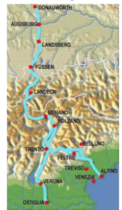
Route der Via Claudia Augusta

Quelle und weitere Informationen: http://www.claudia-augusta.net (de/en/fr/it); http://www.claudiaugusta.com (de/en/it)