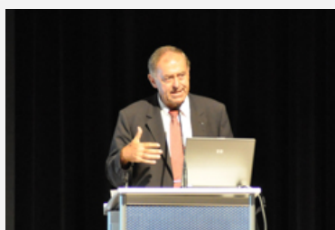
L'esperto di globalizzazione Franz Josef Radermacher delinea gli scenari che si aprono al termine dell'epoca fossile nel convegno annuale della CIPRA 2009.

Il convegno annuale della CIPRA sul tema della crescita, svoltosi la settimana scorsa, ha attirato in Liechtenstein 200 interessati. È emerso chiaramente che la crescita non può essere infinita a causa della limitatezza delle risorse. Sono numerose le idee e le richieste su come affrontare l'inevitabile processo di contrazione. La CIPRA ha sintetizzato le più urgenti in un decalogo di richieste.