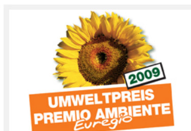
Le prix de l'environnement a pour objectif de faire connaître les questions environnementales à travers toutes les générations et toutes les strates de la société.

Informations complémentaires et source : http://www.transkom.it (de/it), http://www.provinz.bz.it/lpa/285.asp?art=302384 (de/it)