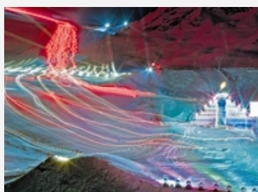
Spectacle « Hannibal » sur le glacier du Rettenbach/A : les pisteurs jouent le rôle des éléphants.

La mise en scène croissante des Alpes est une réalité. Les questions et responsabilités qui en découlent sont cependant encore loin d'être éclaircies. Dans son nouveau numéro d'Alpenscène, « Mount Disney », la CIPRA aborde le phénomène sous différents angles.