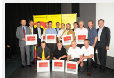
Responsables d'équipes et maires lors de la remise des récompenses

Infos : http://www.energieinstitut.at/?sID=223 (de)