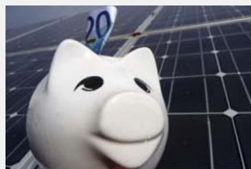
Grazie al progetto vengono creati posti di lavoro e possibilità di risparmio per tutti i cittadini.

Info: http://www.piemontefotovoltaico.it/ (it)