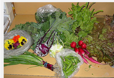
In Francia e in Svizzera nel commercio al dettaglio sono sempre più diffusi i prodotti biologici provenienti da Spagna e Italia.

Fonti: http://www.sga-sse.ch/media/archiv1/jahrestagung/2009/referate/sga_feaneau.pdf (de), http://www.lepoint.fr/actualites-economie/2009-05-20/enquete-l-incroyable-faillite-du-bio-francais/916/0/345177 (fr)