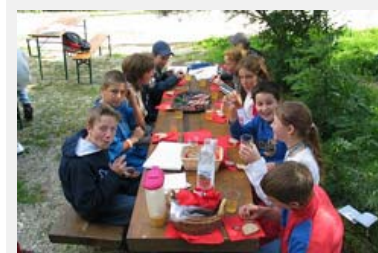
"I giovani – il futuro dei nostri parchi": l'edizione di quest'anno prevede numerose manifestazioni per i bambini

http://www.parc-ela.ch/seiten/set_home.shtml (de), http://www.parks.it/giornatadeiparchi/index.php (it), http://europarc.org/what-we-do/european-day-of-parks (en)