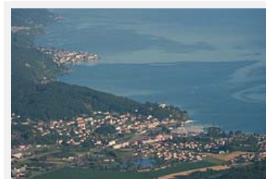
La linea ferroviaria tra Evian/F e St-Gingolph/CH: un elemento centrale per dotare di una mobilità sostenibile la sponda meridionale del Lago di Ginevra.

Fonte: http://www.lenouveliste.ch/fr/news/valais/chemin-de-fer-le-tonkin-enfin-sur-les-bons-rails_9-139796 (fr), http://www.sauvonsletonkin.com (fr)