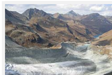
I cambiamenti climatici riducono il potenziale idroelettrico, nonostante il momentaneo aumento dell'acqua di fusione dei ghiacciai.

Info: http://www.netzwerkwasser.ch/klimaaenderung_und_wasserkraft/ (de)