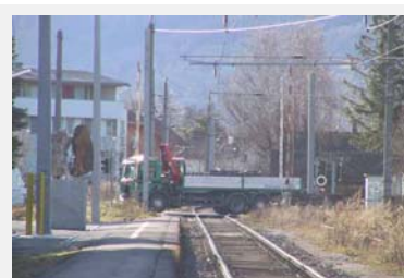
Attraverso le stazioni di misurazione si determina la tariffa da addebitare al trasporto merci su gomma e su rotaia in base al principio di causalità.

Fonti: http://www.nzz.ch/magazin/mobil/der_fussabdruck_des_queterverkehrs_1.761027.html (de), http://www.empa.ch/plugin/template/empa/942/30703/---/l=1 (de)