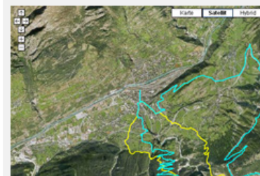
Sulla carta satellitare vengono indicati moltissimi percorsi e i principali punti di interesse.