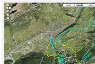
Auf der Satellitenkarte werden unzählige Wege und wichtige Punkte markiert.