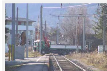
Durch Messstationen wird ermittelt, wie der Güterverkehr auf Strasse und Schiene verursachergerecht zur Kasse gebeten werden kann.

Quellen: http://www.nzz.ch/magazin/mobil/der_fussabdruck_des_gueterverkehrs_1.761027.html (de), http://www.empa.ch/plugin/template/empa/942/30703/--/l=1 (de)