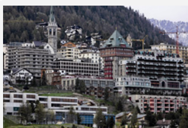
Zweitwohnungen verändern das Ortsbild und können dem Image des Ortes schaden.

In der soeben erschienenen Ausgabe des CIPRA Infos Nr. 87 wird über die Herausforderungen des Zweitwohnungsbaus informiert. Dabei werden Phänomene und Probleme der Zweitwohnungspolitik erläutert, gleichzeitig aber auch bewährte und neue Lösungsansätze aufgezeigt.