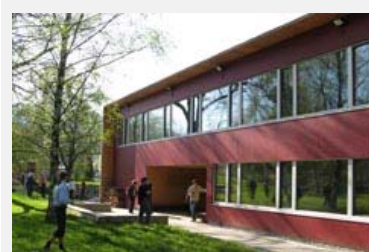
Il fabbisogno energetico per il riscaldamento di una casa passiva è al massimo di 15 kWh/m 2 a.

Fonti e info: http://www.provinz.bz.it/lpa/285.asp?art=218294 (de/it), http://www.oekonews.at/index.php?mdoc_id=1030672 (de), http://www.energiebuendel.li (de)