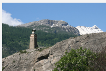
Argentière può essere considerata la porta per l'area centrale del Parco nazionale degli Ecrins.

Più di 300 persone hanno discusso, nell'ambito dell'edizione della Settimana alpina che si è svolta a l'Argentière-la-Bessée/F dall'11 al 14 giugno, sul tema dell'innovazione nelle Alpi e per le Alpi.