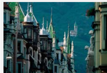
La città di Bolzano si è posta l'obiettivo di diventare clima-neutrale entro dieci anni.

Ulteriori informazioni: http://www.alpenstaedte.org (de/fr/it/sl/en)