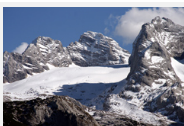
Nell'ambito del progetto MONARPOP sono state condotte ricerche in 40 località isolate di tutto l'arco alpino volte ad accertare la presenza di POPs.

Fonte: http://presse.lebensministerium.at/article/articleview/66367/1/21503/ (de); http://www.umweltbundesamt.at/presse/lastnews/newsarchiv_2008/news080430/?&wai=1 (de); http://www.monarpop.at (en); http://www.umweltbundesamt.de/chemikalien/pops.htm (de)