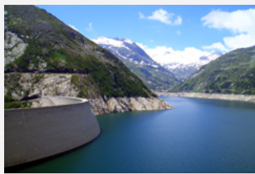
Der Kölnbreinspeicher im Kärntner Maltatal ist bis dato der grösste Speicher Österreichs.

Anfang Mai präsentierten in Wien/A Vertreter der Landesregierung sowie des Verbands der Elektrizitätsunternehmen Österreichs (VEÖ) einen Masterplan, der den Ausbau der Wasserkraft in Österreich vorsieht.