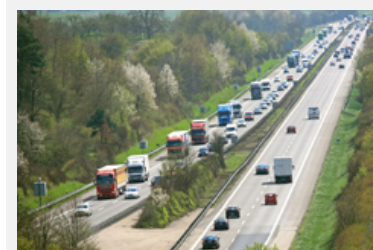
Die Berechnung externen Verkehrskosten ist keine exakte Wissenschaft. Die Studie beruht auf eher konservativen Annahmen.

Quelle und Infos: http://www.are.admin.ch/dokumentation/00121/00224/index.html?lang=de&msg-id=18667 (de/fr/it)