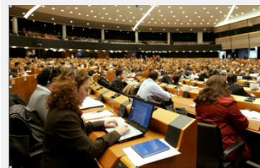
La moderna Agorà sotto il cielo stellato artificiale del Parlamento UE a Bruxelles.