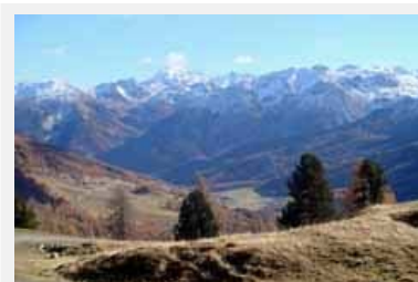
Nel corso di un'escursione nella Val Monastero il progetto Ursina verrà presentato direttamente da chi partecipa alla sua realizzazione.

Fonte e info: http://www.wwf.ch/ (de/fr/it), Programma: http://www.wwf.it/UserFiles/File/News%20Dossier%20Apti/DOSSIER/comunicati%20stampa/volantino%20convegno%20orso.pdf (it/de)