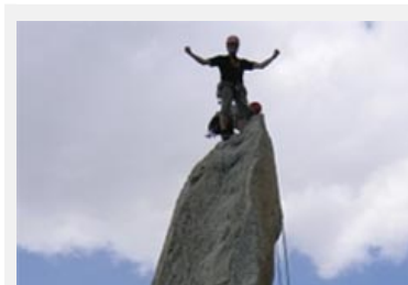
Bergsportler sind längst keine Individualisten mehr, das wirkt sich auch auf die Umwelt aus.

Quelle: Les Oreilles de la Montagne – Lettre hebdo du Réseau MONTAGNE FRAPNA, Nr. 46, 7. August 2007.