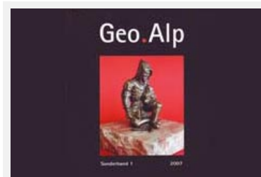
Cover der ersten Sonderausgabe der Zeitschrift Geo.Alp

Die erste Sonderausgabe der Zeitschrift Geo.Alp ist den Beiträgen des 8. Internationalen Symposiums „Das kulturelle Erbe in den Montan- und Geowissenschaften“ gewidmet, das 2005 in Schwaz in Nordtirol/A abgehalten wurde. Thema der Veranstaltung waren frühe geologische Forschungstätigkeiten im Alpenraum und die Arbeiten bedeutender Tiroler Geologen. Der Geo.Alp-Sonderband beinhaltet die 16 Beiträge von 24 AutorInnen aus fünf Nationen, die sich beispielsweise mit der ersten Ausgabe einer geologischen Karte Tirols von 1808 oder mit der Objektivität wissenschaftlicher Arbeiten im frühen 19. Jahrhundert befassen. Im Fokus der weiteren, jährlich erscheinenden Ausgaben von Geo.Alp stehen Themen aus Geologie, Mineralogie, Paläontologie oder historischen Aspekten der geologischen Alpenforschung. Seit 2004 wird Geo.Alp gemeinsam vom Naturmuseum Südtirol/I und dem Institut für Geologie und Paläontologie der Universität Innsbruck/A herausgegeben. Quelle: http://www.provinz.bz.it/lpa/news/news_d.asp?art=180334&HLM=1 (de/it)