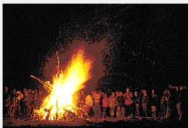
Eines der vielen Mahnfeuer zum Schutz der Alpen.

Am vergangenen Wochenende brannten gegen 40 Höhenfeuer im gesamten Alpenraum für eine nachhaltige Zukunft der Alpen. In der Schweiz, Österreich, Deutschland, Italien und in Kirgistan (Zentralasien) wurden am 11. August Feuer als Symbol für eine bessere Lebensqualität im Alpenraum entzündet.