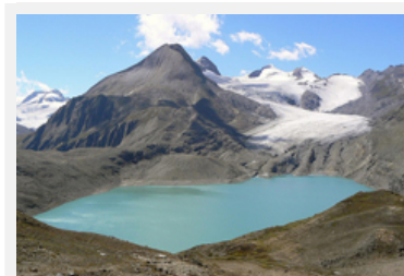
Des fontes dramatiques pour les glaciers alpins : Sonnblückkees/A -2,2 m et Gries/CH -1,7 m

Infos : http://www.grid.unep.ch/glaciers/pdfs/glaciers.pdf (en)