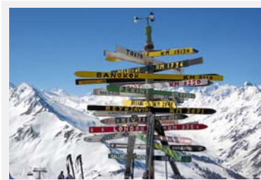
Grands complexes alpins : quelle direction pour le tourisme ?

Les complexes (ou du moins leurs plans) sortent de terre comme des champignons dans les pâturages alpins. Ces concepts de « ville dans un village de montagne » qui nécessitent des investissements pouvant atteindre un milliard d'euros (comme à Andermatt/CH) sont parfois envisagés comme les nouvelles planches de salut du tourisme de montagne. Les constructions nouvelles tiennent-elles leur promesse de création de valeur ajoutée et de lits « chauds » ? Ou bien ces grands ensembles ne sont-ils que de la poudre aux yeux destinée à satisfaire la demande croissante en résidences secondaires de luxe ? Les réponses à ces questions figurent dans ce numéro spécial, qui met l'accent sur le paysage, l'aménagement du territoire et l'architecture, ainsi que sur le recensement des principaux projets de complexes suisses. A télécharger depuis http://www.hochparterre.ch/index.php?id=hp_sonderhefte (de)