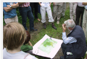
Le tourisme durable et les espaces protégés sont au cœur de divers programmes de formation.

Sources : http://www.sanu.ch/html/angebot/seminare/SF09TO-de.cfm (de/fr), http://iet.hevs.ch/valais/heritage-tourismus.html (de/en/fr), http://mpa.e-c-o.at (en)