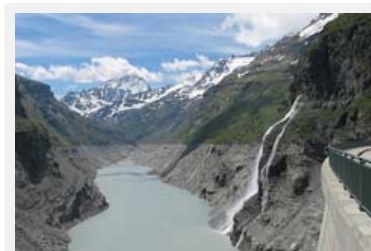
L'énergie hydraulique oui, mais pas de manière illimitée. © PIXELIO

Source : http://moneycab.presscab.com/de/templates/?a=58927 (de), Die Südostschweiz, 31.01.2009