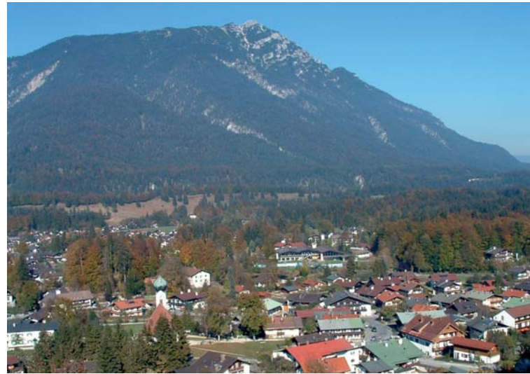
Gemeinde Grainau. Town of Grainau.

Im Sinne einer Gesundheitsvorsorge wird der Urlaub immer mehr als Aktivurlaub verstanden. Um den Gästen dies zu ermöglichen bzw. zu erleichtern, sollen einfache Systeme erstellt werden, um den Aufwand für Organisationen, Vorbereitung usw. möglichst gering zu halten. Die Gemeinde Grainau hat aufgrund ihrer geographischen Lage beste Voraussetzungen dafür, den sanften Tourismus weiter zu entwickeln. Jedoch müssen die vorhandenen Einrichtungen besser angeboten und leichter nutzbar gemacht werden. Das geplante Informationssystem ermöglicht dem Gast bei der Urlaubsplanung das Abrufen entsprechender Informationen und eine bessere Planung seiner Aktivitäten vor Ort in Grainau.