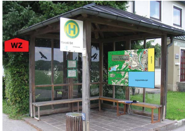
Beispiel für ein Wegeinformationszentrum in Bad Reichenhall. Example of a center of information for paths in Bad Reichenhall.

Ziel des Projekts ist die Reduktion von CO 2 aus verkehrsbedingten Emissionen. Grundlage dafür ist die Bereitstellung einer Umweltinformation für die breite Öffentlichkeit, welche darüber hinaus als Marketinginstrument und Alleinstellungsmerkmal zur Positionierung der Stadt im Tourismus dient. Das Projekt strebt die Integration neuer sowie bereits bestehender Tourenvorschläge in und um Bad Reichenhall an, die von einer Vielzahl von Interessensgruppen entwickelt worden sind. Dabei werden die bestehenden Wegeressourcen geordnet und genutzt. Ferner wird durch die Einbeziehung der vorhandenen Infrastruktur eine gesteigerte ökologische und ökonomische Wirkung erreicht.