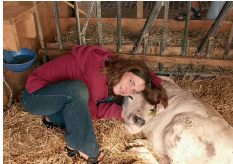
Biosphärenschule in der UNESCO Biosphäre Entlebuch. Biosphere school in UNESCO biosphere Entlebuch.

Die Ziele des Projekts sind die Koordination der Gemeindeprojekte im Rahmen der UNESCO Biosphäre Entlebuch (UBE), die Optimierung der Ressourcennutzung, Synergien schaffen und Informationsaustausch gewährleisten und die Mobilisierung der Eigeninitiative von Gemeinden. Die Akteure aus den Gemeinden informieren sich gegenseitig im Rahmen eines Workshops über ihre Aktivitäten, definieren ihre Bedürfnisse und erarbeiten gemeinsam Handlungsstrategien. Sie werden dabei vom Regionalmanagement der UBE unterstützt.