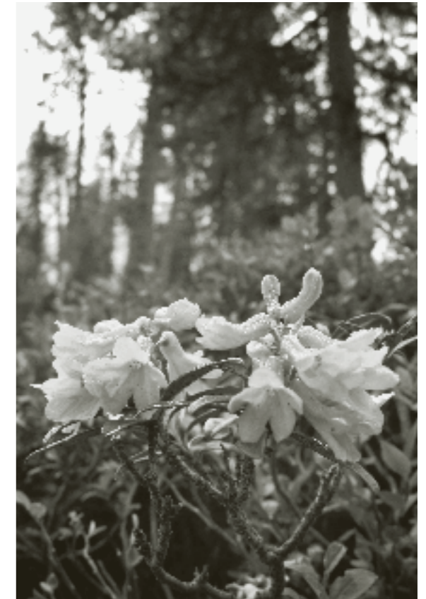
È tutta questione di terreno: il rododendro ferrugineo (foto) ama le torbiere alte acide. Il rododendro irsuto è leggermente peloso ai bordi delle foglie, ama il terreno calcareo della Schratentfluh, un paesaggio carsico di notevole bellezza. Entrambe le specie sono presenti in grandi quantità nell’Entlebuch grazie al suo paesaggio, che si alterna come un mosaico.

velli della popolazione”; in fondo l’introduzione della biosfera è stata possibile anche nella struttura attuale. Un referendum è previsto per il 2008.